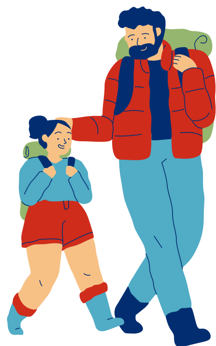
Люди с ОВЗ